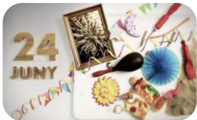
Sant Joan del 15 al 22 juny