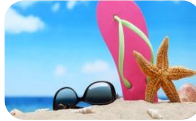
Vacances : 2 setmanes entre el 3 i 24 juliol