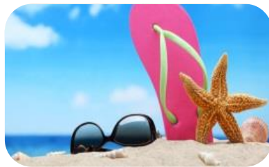
Vacances : 2 setmanes entre el 3 i 24 juliol