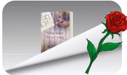
Sant Jordi del 14 al 23 d'abril