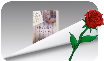
Sant Jordi del 14 al 23 d'abril