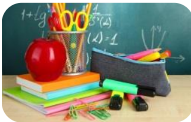
Tornada escola : una setmana entre 24-28 agost-8 setembre