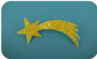
Nadal : 2 setmanes entre 30 novembre i 22 desembre