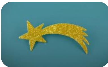
Nadal : 2 setmanes entre 30 novembre i 22 desembre