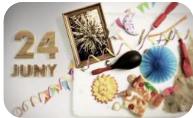
Sant Joan del 15 al 22 juny