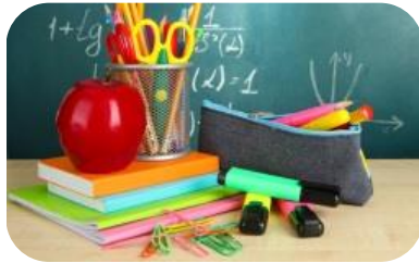
Tornada escola : una setmana entre 24-28 agost-8 setembre